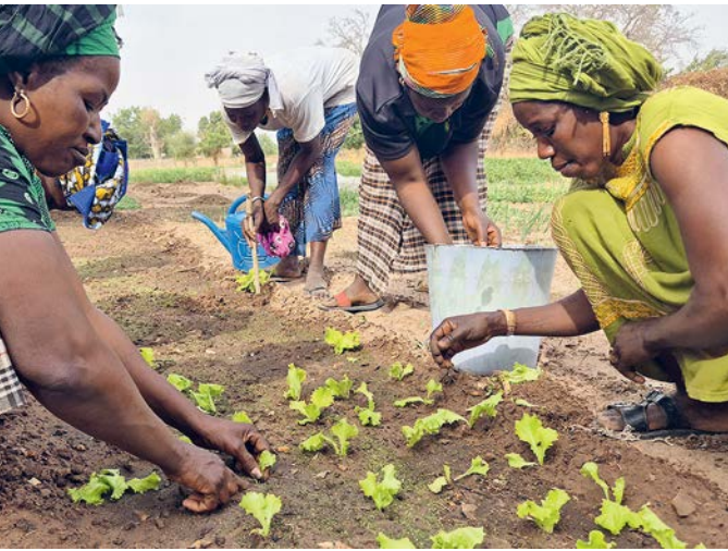
Frauen werden in nachhaltiger Landwirtschaft geschult.