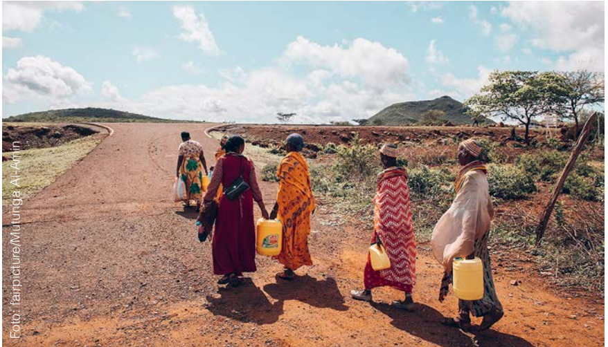
Frauen werden dabei unterstützt, ihre Lebensgrundlage an die Klimakrise anzupassen.

auswirkt. Gleichzeitig zeigt sich die beeindruckende Kraft der einheimischen Frauen: In einer von extremer Hitze geprägten Region (eine Dürre ließ 2022 über 2,5 Millionen Nutztiere verenden) übernehmen sie trotz großer Unsicherheit und weiten Wegen zu Wasserstellen Verantwortung.